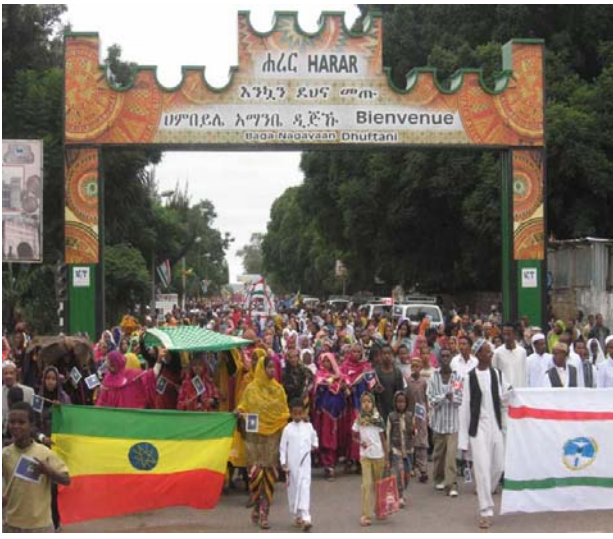
አመትዚኛ ዚሐረር ሚሊኒየም ላረኡው ዚአድዳተቃጠርት ኪሰሆት

ሐረርጌይሌ ቆጥ ጌይ ዝቱ ሐረርጌይ መጋቢ ዩ አያም ዋ ዩ አመት ተኤሰሰቲሌ ከስተንቤ ዝትቆጩ አያም አይንበርማም አብዘህ ታሪኽ ኡሱአት 1200ቤ ዘይእነሰ ሰንኒ ሀሌቤ ይትካህላሉ። ዩው እድዴቤ የረግዚኩተ ናሻመ